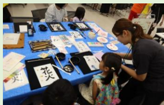
書道アート (滋賀県立大学 書道サークル繋KIZUNA)