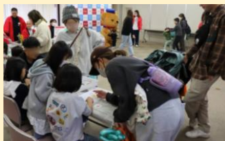
缶バッチづくり&ぼすくまと記念撮影 (滋賀県内郵便局)