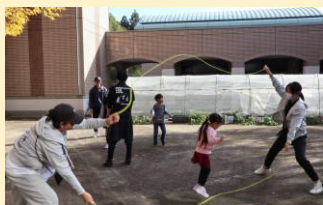
ダブルダッチに挑戦しよう！ (大津縄部)