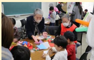
折り紙・バルーンアート (NPO法人レイカディアえにの会)

普段から、ご寄付や食材・物品のご提供、ボランティア・体験でのサポートなどをいただいている企業・団体の皆さんがご協力くださいました！