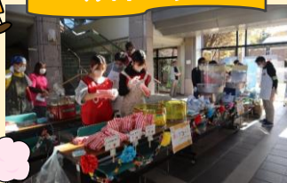
淡海フィランソロピーネット 龍谷大学 学生ボランティア・子どもスタッフ