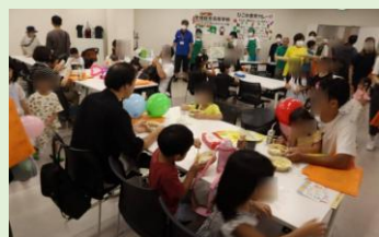
ひこね食育カレー (彦根総合高等学校 フードクリエイト科)