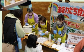
「逢坂わだち五平餅」作り体験 (わだち食堂／大津市)

子ども食堂コーナーでは、県内3食堂がご協力くださり、実際に子ども食堂でも提供している五平餅や人気のゲームなどでたくさんの子どもの笑顔をしてくださいました。子どもたちを見守る優しいまなざしや大人も子どもと一緒に楽しんでいる姿があたたかく活気があふれる空間でした(^ ^)