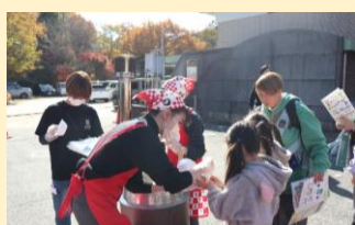
炊いてみよう！食べてみよう！かまどごはん (JA滋賀中央会・JALが女性協議会 JAIバンク滋賀信連)