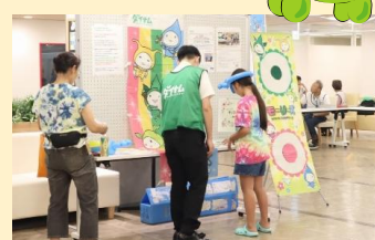
モリスケと的あて♪ (株)ダイナム)