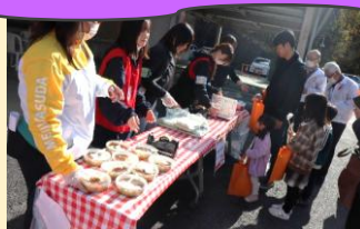
淡海フィランソロピーネット 龍谷大学 学生ボランティア