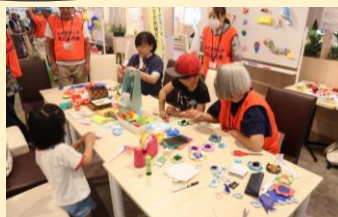
バルーンアート・折り紙 (NPO法人レイカディアえにしの会)