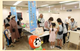
人KENまもるくん・人KENあゆみちゃんによる ウォークバルーン、啓発手作りキーホルダーほか (彦根人権擁護委員協議会)