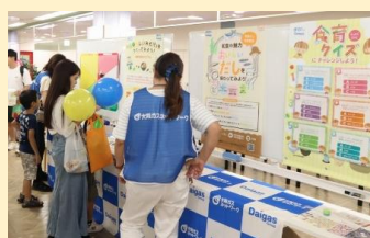
食べ物クイズに挑戦！ (大阪ガスネットワーク(株)京滋事業部)