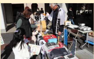
ガラポン抽選 他 (近江米振興協会)