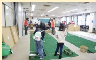
シャッフルボード・いごボール他 (NPO法人レイカディアえにの会)