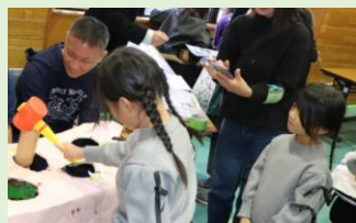
人力もぐらたたきゲーム (eataalk／大津市)