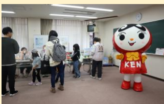
人KENあゆみちゃんウォークバルーン キーホルダーづくり体験他 (大津人権擁護委員協議会)