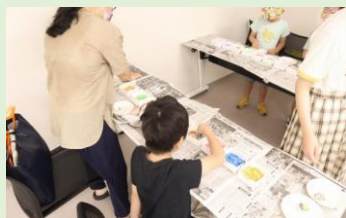
キャンドル製作体験 (滋賀県立大学 近江楽座あかりんちゅ)