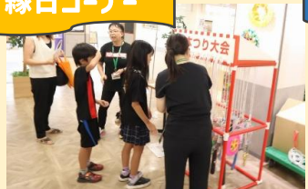
千本釣り(アル・プラザ彦根)