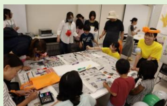
プラ板deアクセサリ (滋賀県立大学 ハンドメイキング部)