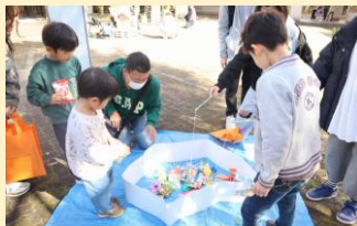
缶バッチづくり・紙ひこうき飛ばし他 (男性保育士プロジェクト)