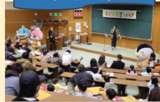
ゆかい！げんき！保育マン参上！