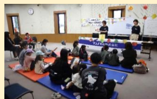
「野菜・果物ビンゴにチャレンジ！」 (フジノ食品(株))