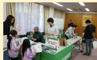
見て触って匂って当てよう 野菜・果物クイズ♪ ((株)平和堂)