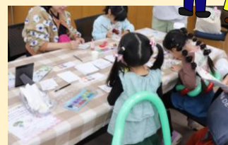
バロー・Vドラッグ コスメ&タイルアート ((株)バローホールディングス)