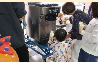
ソフトクリーム巻き巻き体験 (日世(株)びわ湖工場)