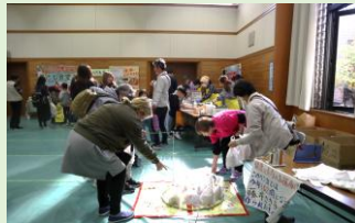
ペン立て釣りゲーム (みんなの食堂ひとやすみひとやすみ／甲賀市)

淡海フィランソロピーネットと 龍谷大学学生ボランティアのコラボ による射的体験コーナーも