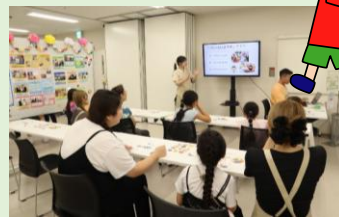
めざせ！栄養レンジャー BohNoとお弁当大作戦 (立命館大学 学生団体BohNo)